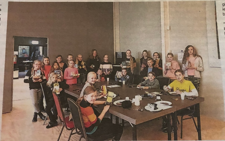
De kinderen namen voedsel mee naar Glinstra State, bestemd voor de Voedselbank Burgum.

Met andere woorden: de activiteiten van de FCJT zijn er niet uitsluitend om de kinderen (in coronatijd)